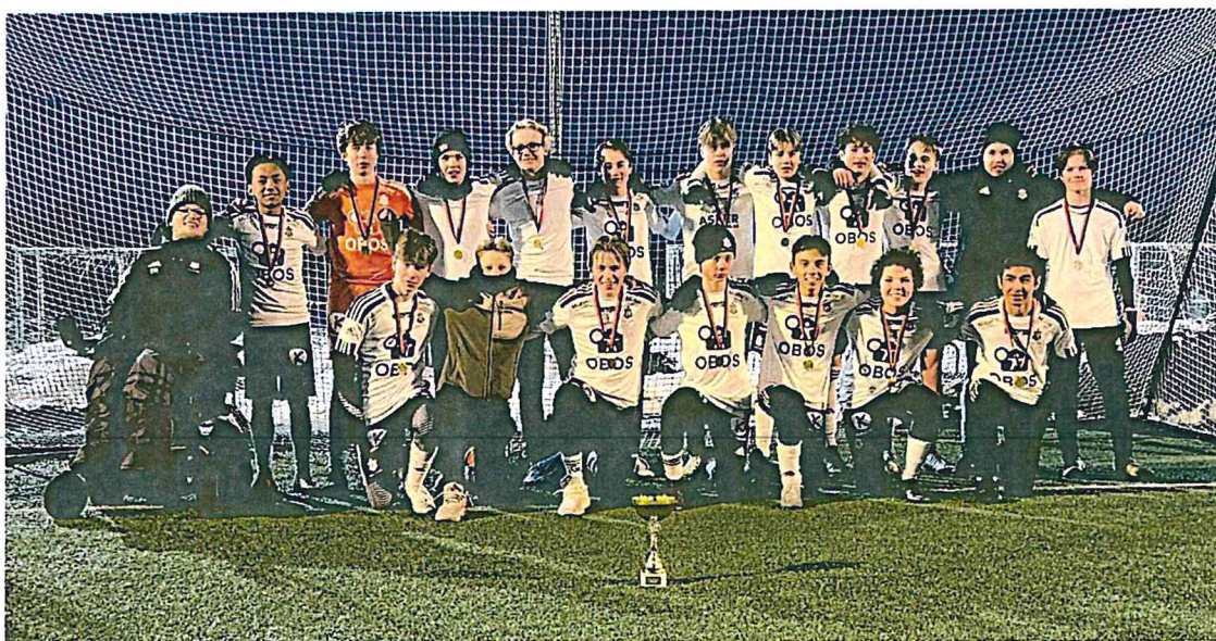
Bilde fra Stoppen vintercup, der guttene gikk hele veien til topps og fikk med seg pokalen hjem til Føyka.