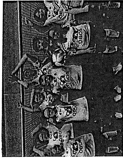
en helt vanlig fotballkamp: - Vi er stolte